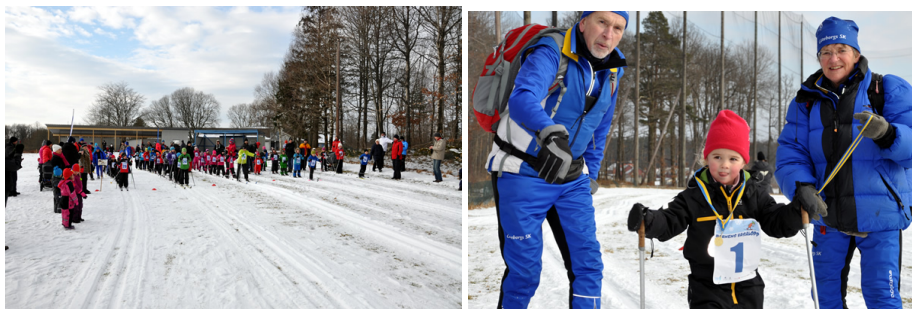
Starten i Barnens vasalopp samt några av våra funktionärer och liten skidklubbare med medalj.